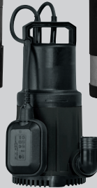
NOVA SALT W